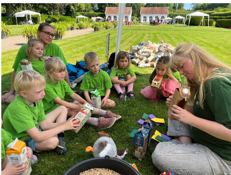
Ved Børnekulturfestivalen kunne børnene prøve kræfter med mange forskellige former for kunst og kultur. Blandt andet kunne børnene prøve kræfter med at bygge musikinstrumenter af brugte mælkekartoner.