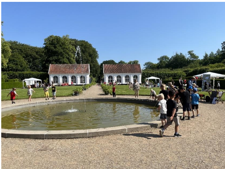
Det summende af liv den 27. juni, hvor over 300 børn var mødt op til børnekulturfestival i herregårdshaven på Gammel Estrup.