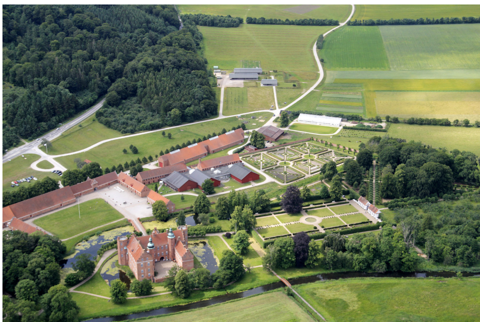
De to nabomuseer Gammel Estrup Danmarks Herregårdsmuseum og Det Grønne Museum ligger i naturskønne omgivelser

Men det er også et tegn på, at vores trang til at udforske, lære og engagere os i vores omgivelser og historie stadig brænder stærkt og, at vores kulturarv forbliver en kilde til inspiration og stolthed.