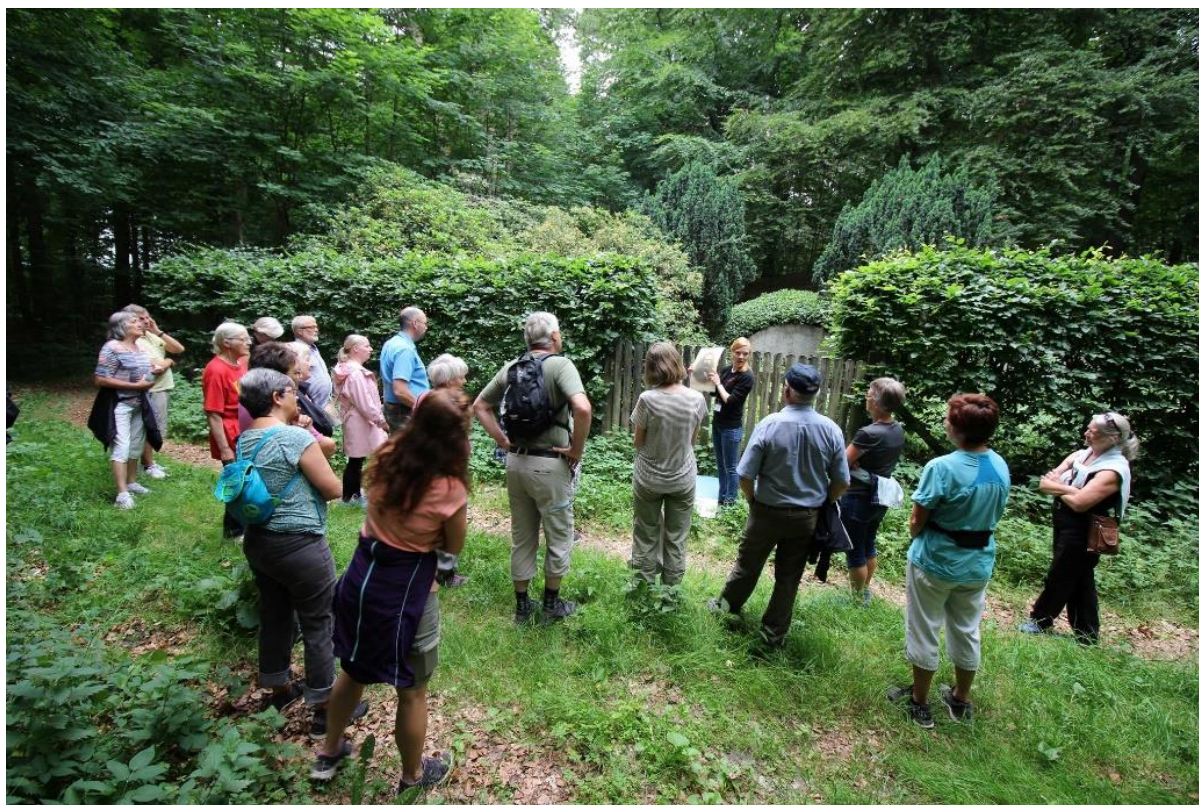
I 2021 etableres en digital oplevelsessti fra Gammel Estrup gennem herregårdsskoven Lunden. Stien ledsages af en række arrangementer og guidede ture i sommeren 2021.