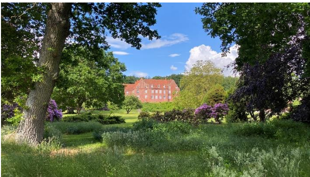
Støvringgaard kloster øst for Randers ligger i et naturskønt område ned til Randers Fjord, og landskabet bærer tydeligt præg af herregården, der kendes tilbage fra Middelalderen.