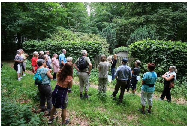
I den gamle herregårdsskov Lunden ved herregården Gammel Estrup på det nordlige Djursland, kan man se mange spor af adelslægten Scheel, der ejede herregården gennem 600 år, bl.a. en iskælder, en kærlighedssti og familiegravstedet, der ses her.