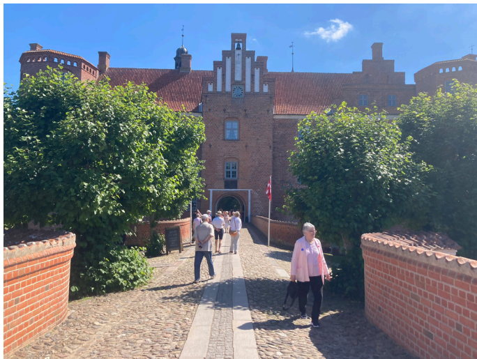
Gammel Estrup Danmarks Herregårdsmuseum har haft en travl sommer med mange glade gæster. Et trækplaster har blandt andet været åbningen af den nyrestaurerede kælder under herregårdens sydføj.

Efter nogle år, der har været præget af nedlukninger, restriktioner og Covid-19; så var der i sommerferien 2022 igen åbnet helt op for den danske kultur- og underholdningsbranche.