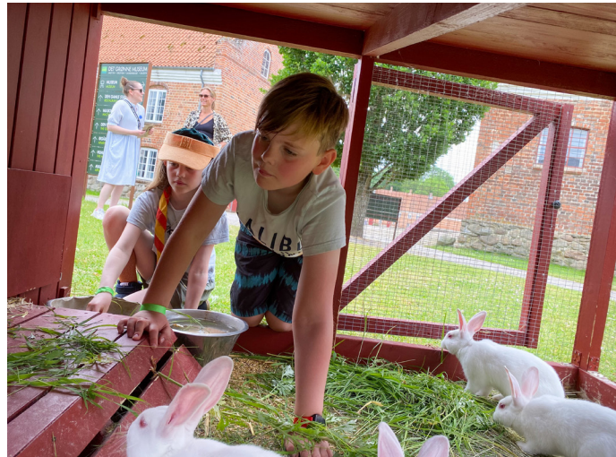
Det var en god sommer, med masser af glæde gæster på Det Grønne Museum. Uanset årstid er de levende dyr en af børnenes favoritter.

- Vi har, som altid, gjort meget ud af vores sommeraktiviteter. Vi formidler i nogle rigtig gode rammer både udendørs og indendørs og har dertil også gode frivillige kræfter. Disse ville vi rigtig gerne bringe i spil sammen i den dejlige sommerperiode. Det er derfor skønt at mærke, at vores gæster har taget godt imod det og er vendt talstærkt tilbage efter to år med Covid-19.