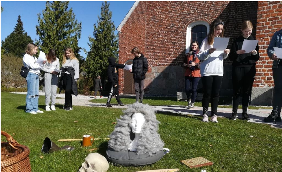
Gammel Estrup Danmarks Herregårdsmuseum står bag oplevelser for børn og unge, der kan benyttes af præster og undervisere omkring de lokale sognekirker.

For yderligere information om ”Gud blandt godtfolk og grever” se gammelestrup.dk/gud-blandt-godtfolk-og-grever/ eller kontakt museumsinspektør Anders Sinding på ans@gammelestrup.dk eller T 8648 3001 / 8795 0705.