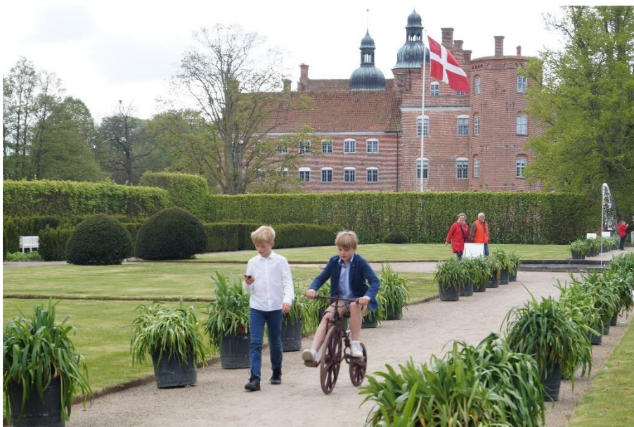
På Gammel Estrup Danmarks Herregårdsmuseum kan man besøge Herregårdshaven, der summer af liv og aktiviteter hver dag i sommerferien.

Gammel Estrup Danmarks Herregårdsmuseum, Britta Andersen, ba@gammelestrup.dk eller 3146 3001.