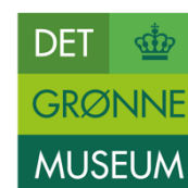
JAGTEN • SKOVEN LANDBRUGET • MADEN