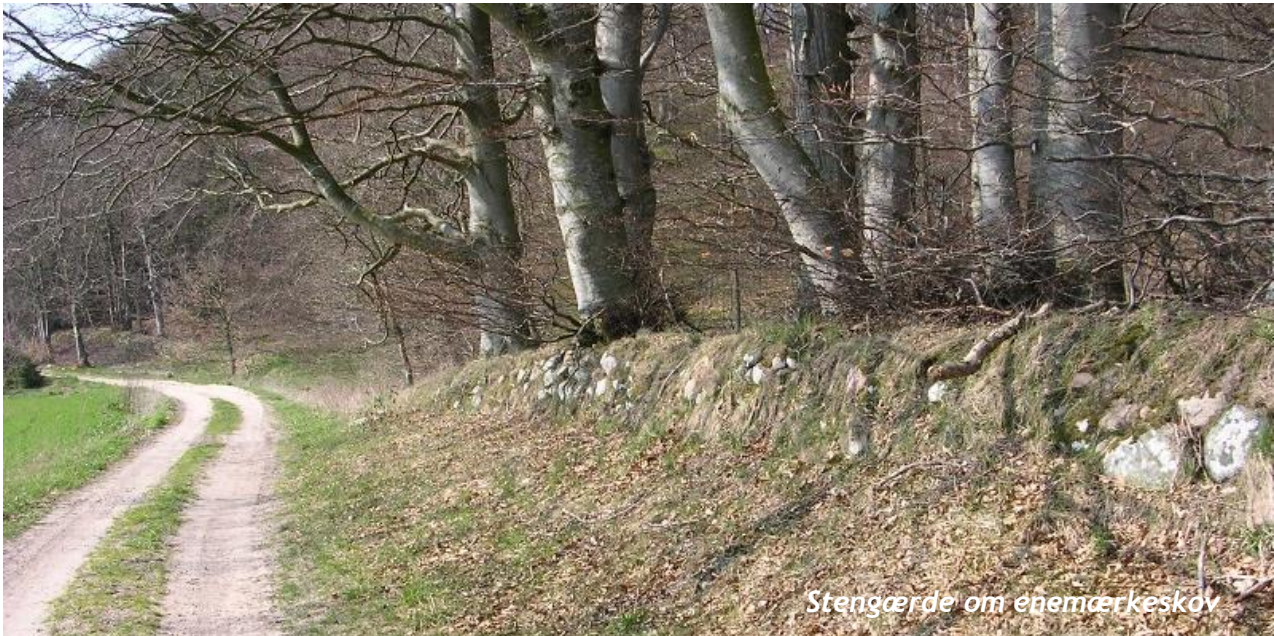
Stengærde om enemærkeskov

Stengærder blev ofte anvendt ved herregårde som en afgrænsning mellem agerbrug og herregårdsskov og som en markering af ejendomsforhold. Mange af herregårdsområdernes stengærder stammer fra tiden omkring 1805, hvor skovene skulle hegnes ifølge Fredskovsforordningen 1805. De gamle stengærder er samtidig vigtige levesteder for dyr og planter og udgør således vigtige småbiotoper