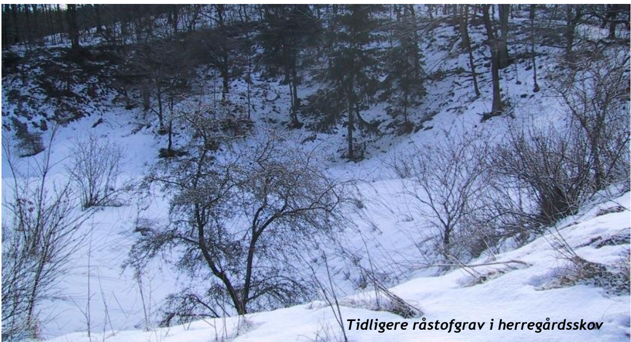
Tidligere råstofgrav i herregårdsskov

Godskompleksernes mange ombygninger og nybygninger har efterladt sig spor i form af rester fra råstofgrave, som stadig kan anes i det nutidige herregårdslandskab i form af fordybninger, hvor man har hentet ler eller grus til byggerier.