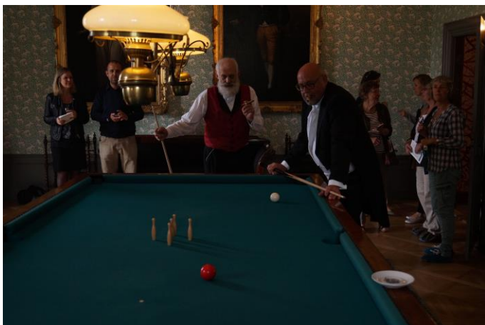
Bogen 'Herregård og herskab' blev lanceret på herregården Gammel Estrup ved et festligt selskab inspireret af det festlige herskabsliv, som bogen beskriver.