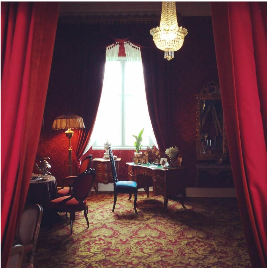
Dagligstuen på Gammel Estrup viser, hvordan man indrettede sig i det sene 1800-tal på landets rige godser. Her er familiehyggen sikret med tunge møbler, tæpper og gardiner i mørke farver blandet med nips og pyntegenstande.