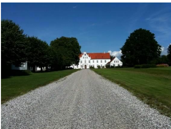
Vosnæsgård er en af de mange herregårde, hvis navn dukkede op under arbejdet med arkiverne fra politiretten. En af de mere spektakulære sager i undersøgelsen omhandler 5 malkepiger, der i 1870 blev idømt fængsel på vand og brød for at have kastet med komøg og tævet mejeribestyreren på Vosnæsgård med deres malkeskamler.