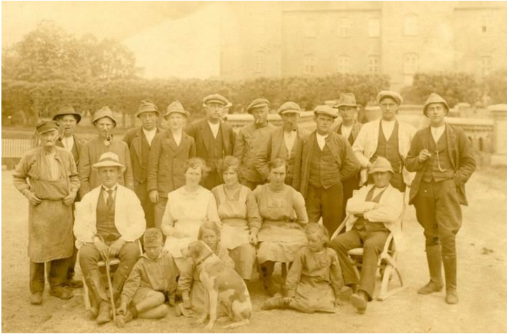
Folkeholdet på Gammel Estrup omkring 1920. Helt frem til dette tidspunkt var tjenestefolk og landarbejdere på både herregårde og bondegårde underlagt en særlovgivning, der gav deres husbond udstrakt myndighed over dem.