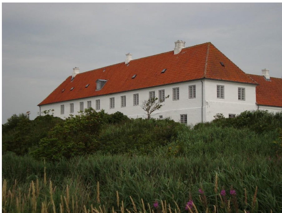
Tv. Vestjyske herregårde var påvirket af europæiske strømninger indenfor kunst, kultur og arkitektur, som landsdelens beboere dermed også stiftede bekendtskab med. Herregården Kabbels ejere ved Lemvig skænkede et rigt inventar i Rokokostil til Nørlem Kirke.