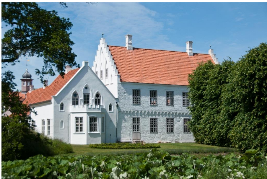
Nørre Vosborg er en af de vestjyske herregårde, der besøges på herregårdsturen. Her skal deltagerne både spise festmiddag og overnatte.