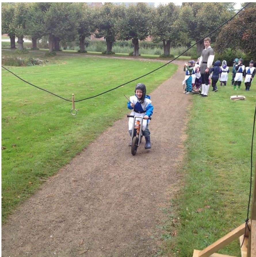
Den nye kulturjeneste i Norddjurs arbejder med tilbud til børn og unge helt ned i børnehavealderen. Det er et både sanseligt, aktiverende og lærerigt møde med kulturarven, når børnehavebørn prøver kræfter med at være riddere for en dag på Gammel Estrup.