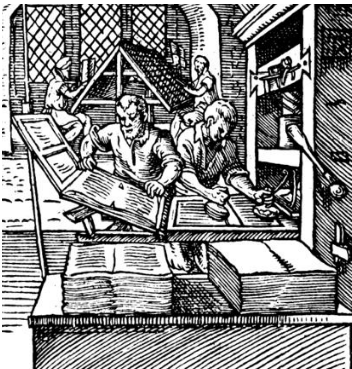
Øjebliksbillede fra et bogtrykkeri år 1568. Til venstre ses en arbejder der fjerner en færdigtrykt side, til højre kommer en anden blæk på tekstblokkene, så maskinen igen er klar til brug. I baggrunden ses ”sætterne”, der klargør sætterammerne til de næste sider, der skal trykkes.